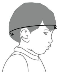
Obvod hlavy dieťaťa

Tip: Ak nemáte krajčírsky meter, zmerajte obvod hlavy akoukoľvek šnúrkou a nameranú dĺžku šnúrky potom zmerajte pevným metrom.